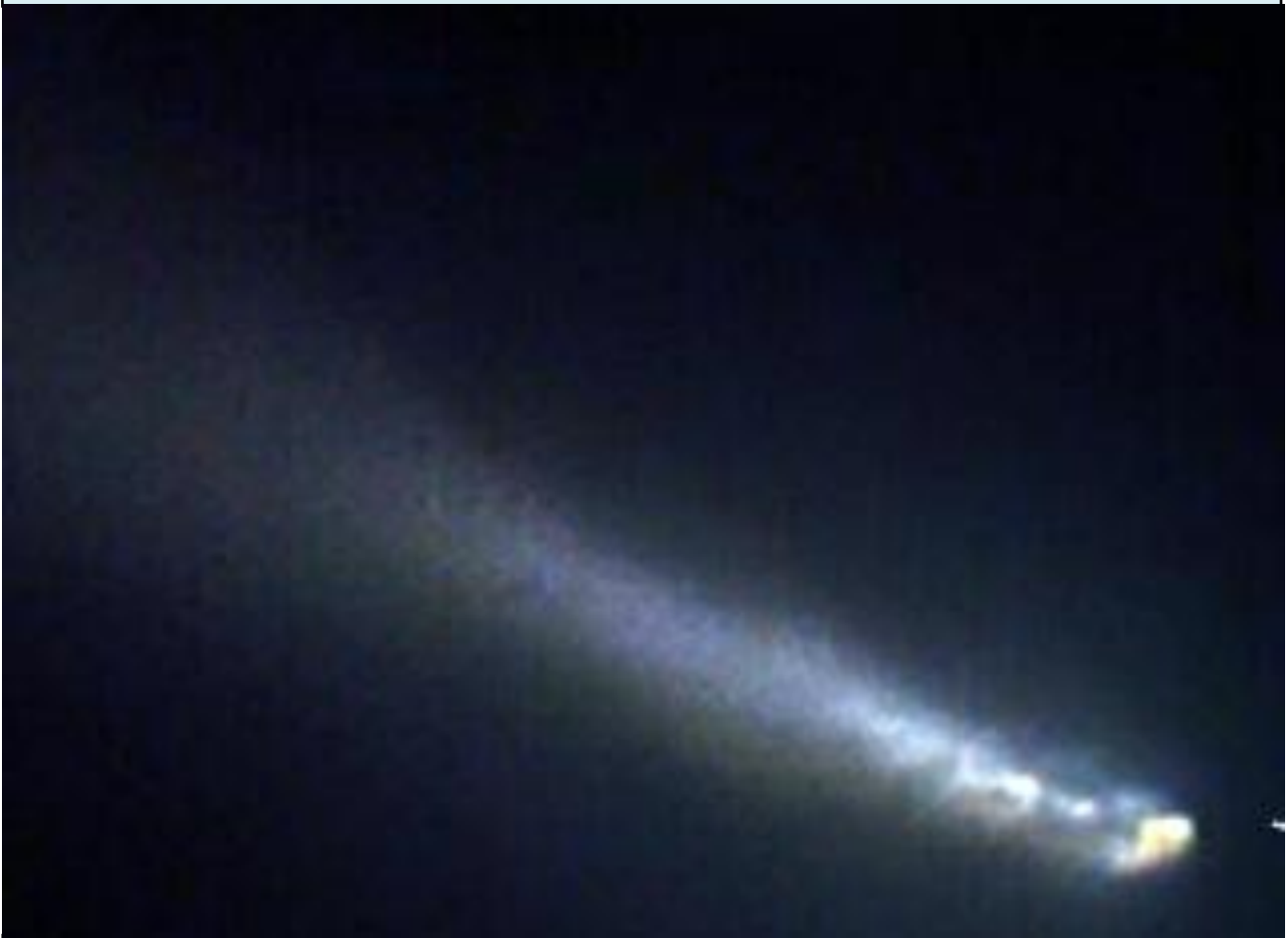
La cometa Atlas C/2020 Y4 mentre si sta frammentando. Immagini come questa lasciamo letteralmente senza parole.

La cometa Atlas nel mese scorso ha improvvisamente iniziato a frammentarsi in più parti, affievolendosi molto, e per questo la sua luminosità è diminuita notevolmente, portandola a non essere visibile né ad occhio nudo, né con binocoli. La fotografia che la mostra frammentata lascia perplessi gli astronomi per la distanza che dovrebbe avere dal sole il 31 maggio prossimo, pari a 0.25 u.a. ( 1 u.a. corrisponde alla distanza terra-sole, pari a 150 milioni di Km.), ancora molto distante dal perielio, e la sua frammentazione è avvenuta a distanze da 3.000 a 5.000 Km dal nucleo cometario.