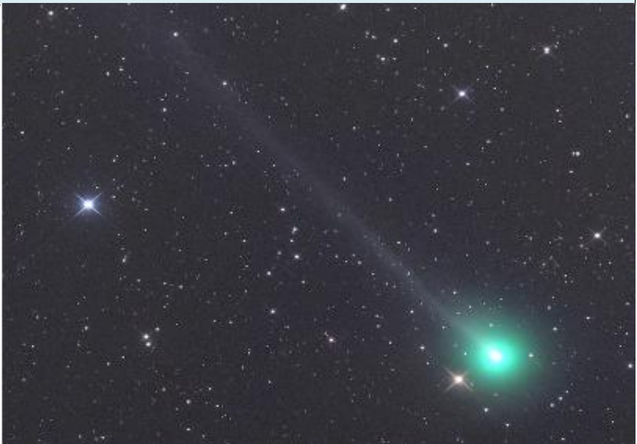
Una seconda immagine spettacolare di un'altra cometa. La cometa Swan C/2020 F8 ripresa in marzo dall'emisfero australe.

Generalmente per osservarla al meglio e registrare sue immagini al telescopio, vanno utilizzati filtri colorati come in particolare il viola, che attenua la sua forte luminosità e permette di ridurre la turbolenza dell'immagine dovuta all'evaporazione degli strati bassi atmosferici.