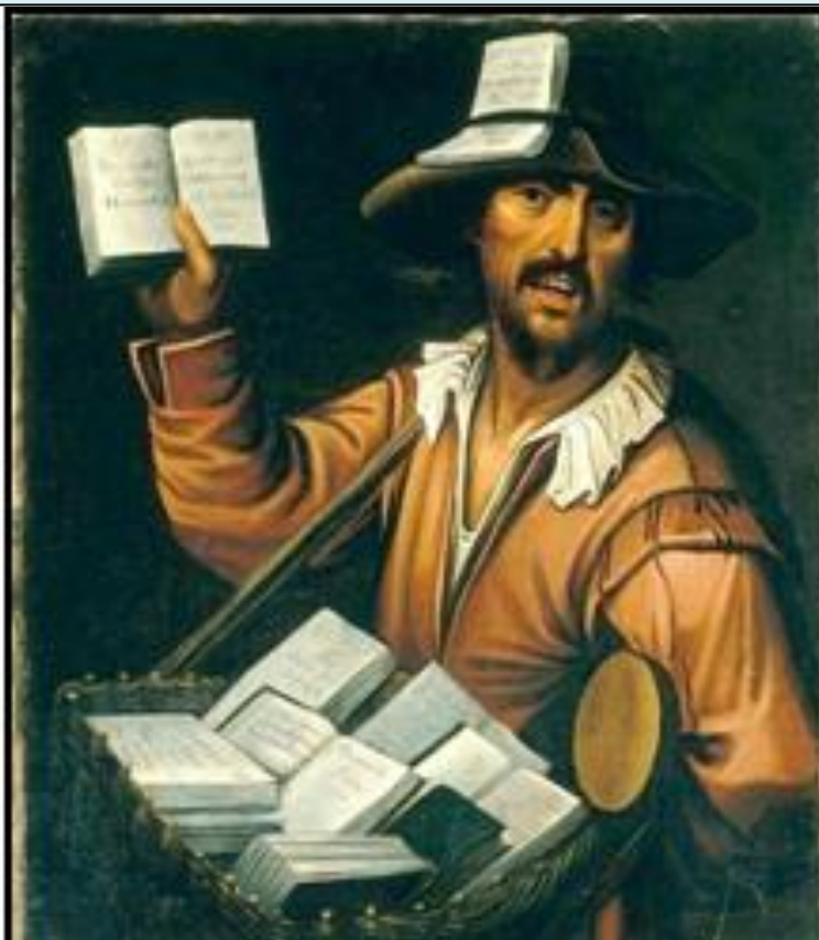
Anonimo francese - Venditore ambulante («Le colporteur») XVII secolo, Paris Musée des Civilisations de l'Europe et de la Méditerranée

Io non ho mai comprato un "lunario" ma, come molti di voi, anch'io ho festeggiato il capodanno 2020 e ho detto: "Speriamo!"; e continuo a dirlo.