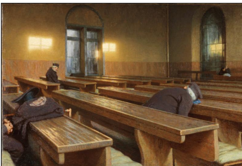
Giorno di Festa al Pio Albergo Trivulzio Angelo Morbelli (1853 - 1919)