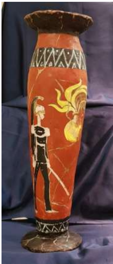
34 2021 Alabastron, Vaso etrusco con coppia di Corazzieri e Fiamma dei Carabinieri, tecnica mista su cartapesta, alto 55.

....Cavalli .... Cavalieri e ....Cartapesta