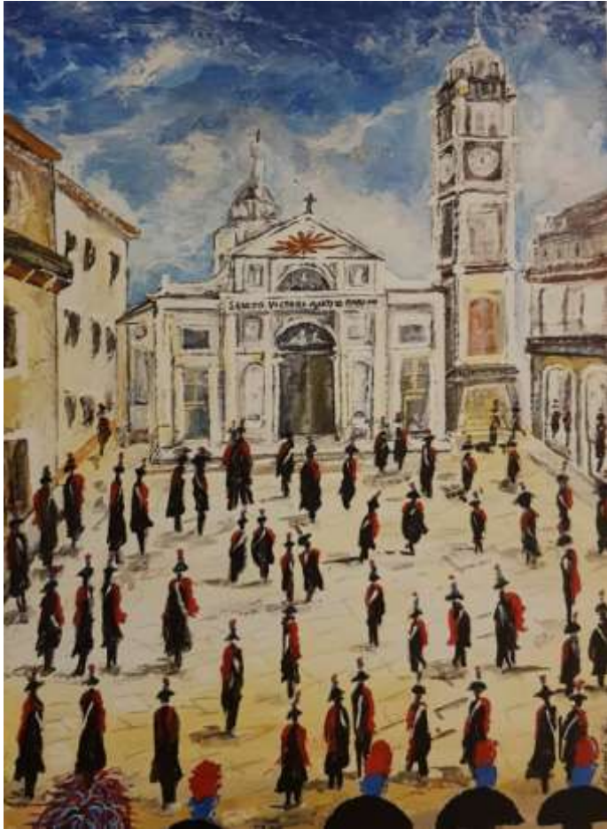
38 2021 Carabinieri in Piazza San Vittore