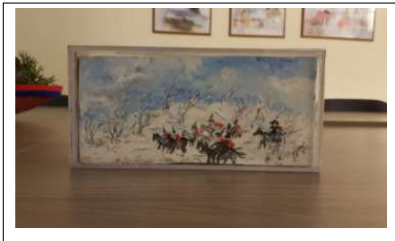
23/2 2021 Cavalieri sulla neve, parte posteriore della teca n,23 in plexiglas.

....Cavalli .... Cavalieri e ....Cartapesta