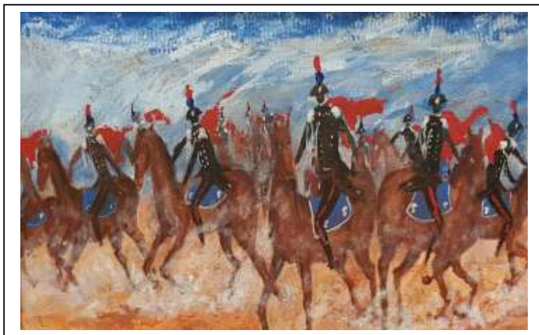
10 2021, La carica dei Carabinieri, tecnica mista su cartone 51 X 92.

....Cavalli .... Cavalieri e ....Cartapesta