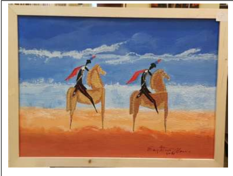
3 2021, Carabinieri stilizzati su cavalli dorati , tecnica mista su cartone, 49 X 67.