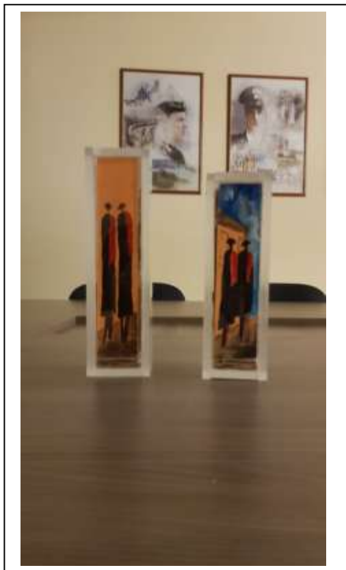
27/1 parte posteriore della teca n.26

....Cavalli .... Cavalieri e ....Cartapesta