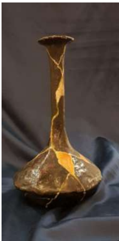
35 2020 Bottiglia a forma conica porta olio profumato, tecnica mista su cartapesta, alta 35 x 22.