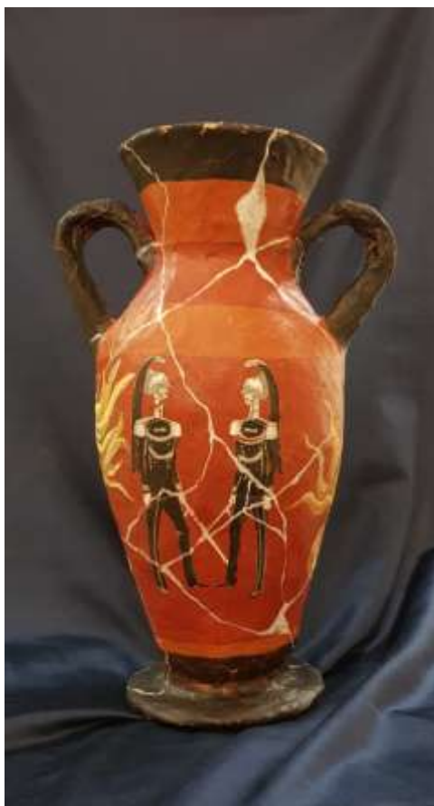
33 2021 Anfora etrusca con coppia di Corazzieri e sui lati la Fiamma dell'Arma dei Carabinieri, tecnica mista su cartapesta, altezza 52.