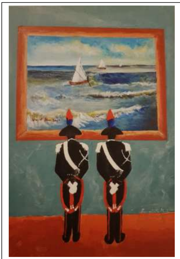
24 2020 Serie Carabinieri al museo – il mare di Van Gogh, Stampe su polipropilene, (un polimero termoplastico) numerate ANC VA 1/50 – 50/50