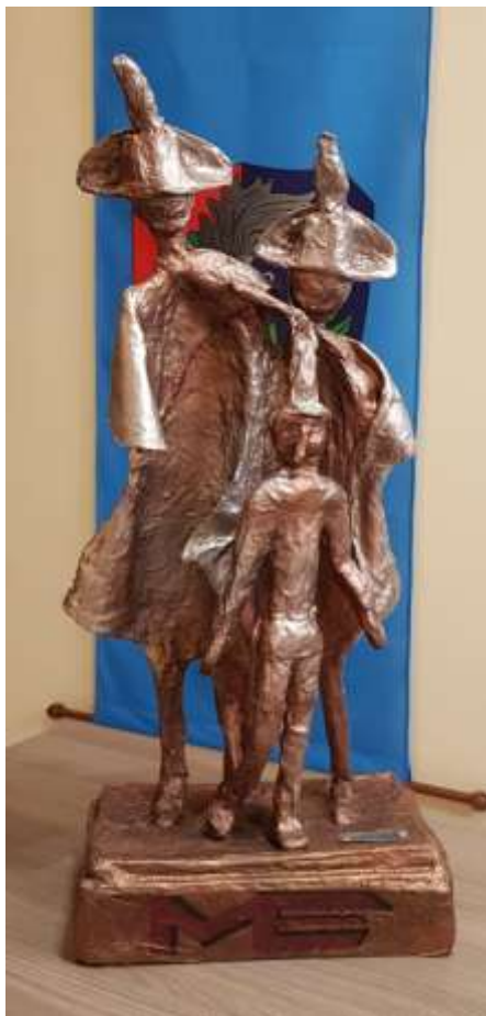
32 2020, Carabinieri arrestano pinocchio, tecnica mista, scultura in cartapesta, 54 x 30.

....Cavalli .... Cavalieri e ....Cartapesta