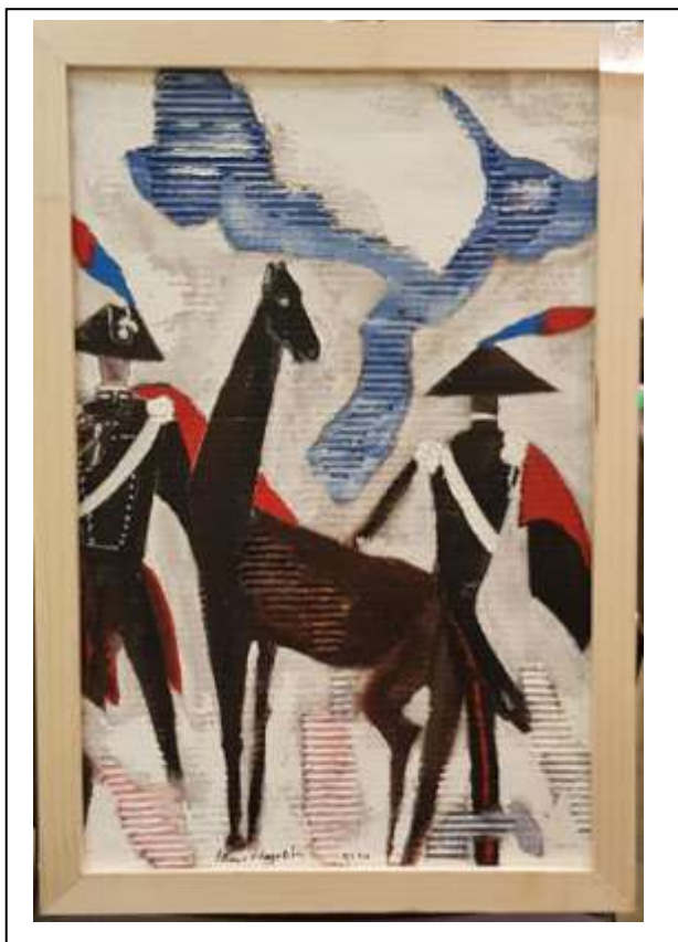
8 2021, Carabinieri e il Cavallo,, tecnica mista su cartone, 42,5 X 61.

....Cavalli .... Cavalieri e ....Cartapesta