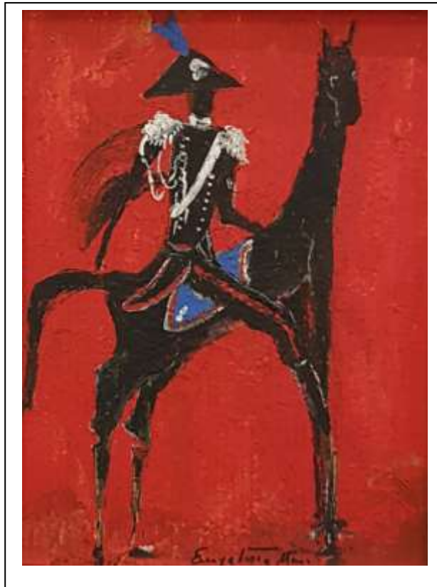
7 2021, Brigadiere dei Carabinieri a cavallo, tecnica mista su cartone , 45 X 45.