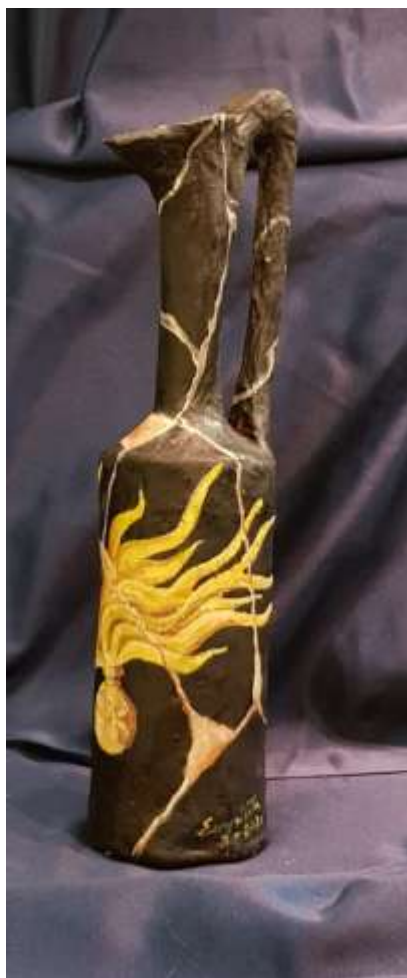
37 2020 Lekythos Bottiglia porta olio profumato con fiamma dei Carabinieri, tecnica mista su cartapesta, alta 35.