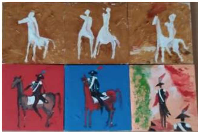
22 La parte posteriore delle teche precedenti 19,29,21.