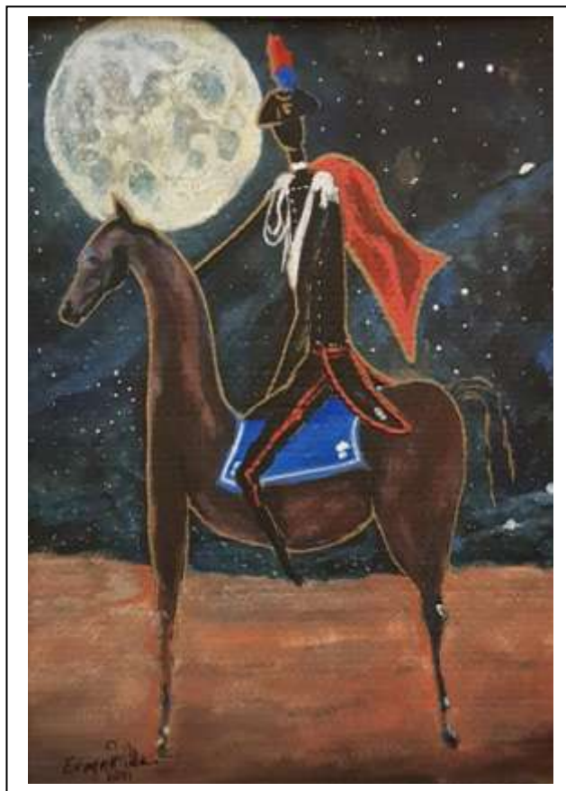
2 2021, Carabiniere a cavallo sotto la Luna Piena e cielo stellato , tecnica mista su cartone , misure 49 X 67.

....Cavalli .... Cavalieri e ....Cartapesta