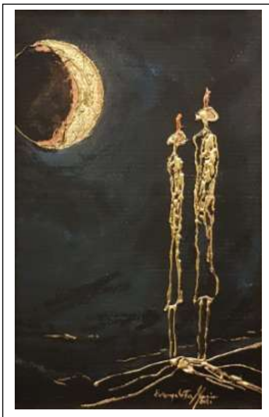
18 2021, Carabinieri, luna crescente, tecnica mista su cartone, 42 x 61.

....Cavalli .... Cavalieri e ....Cartapesta