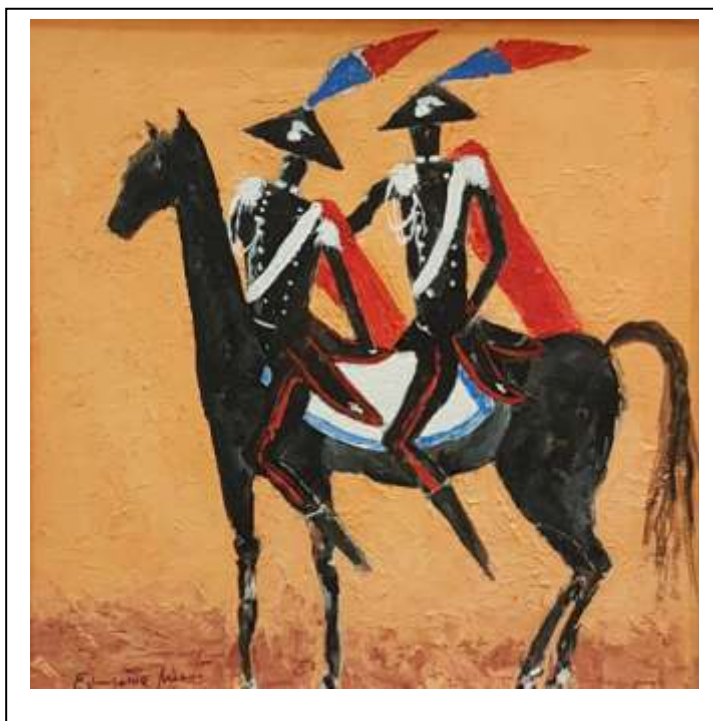
5 2021, Carabinieri a Cavallo ,tecnica mista su cartone, 45 X 46.