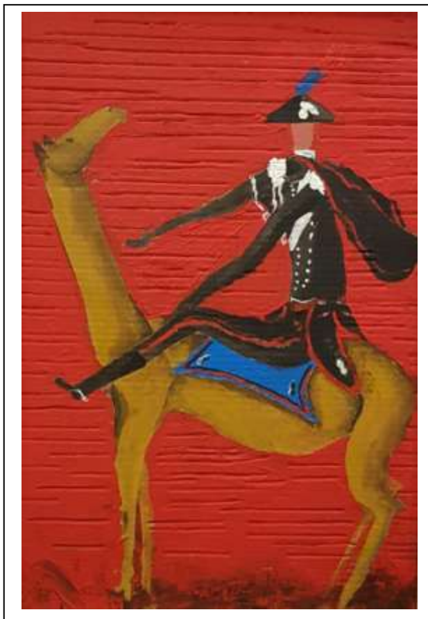
4 2021, Carabiniere a cavallo su fondo rosso, tecnica mista su cartone , 42 X 44,5.

....Cavalli .... Cavalieri e ....Cartapesta