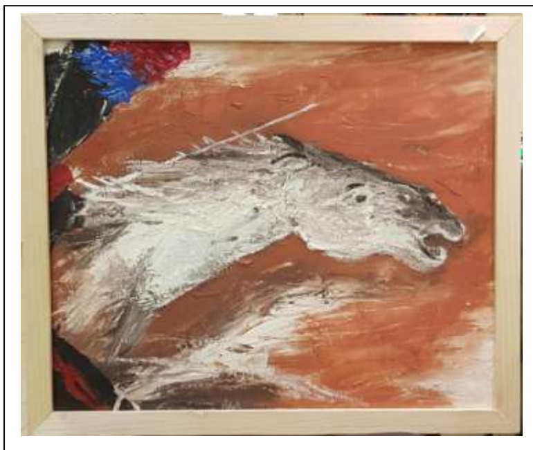
6 2020, Cavallo in corsa, tecnica mista su cartone, 50 X 60.

....Cavalli .... Cavalieri e ....Cartapesta