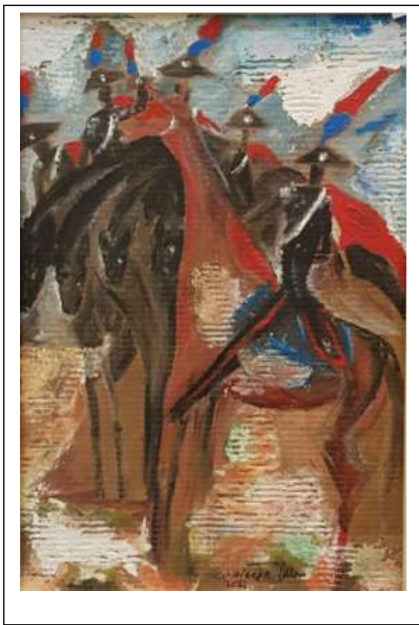
15 2021, Il riposo dopo la carica, tecnica mista su cartone 42,5 X 61.