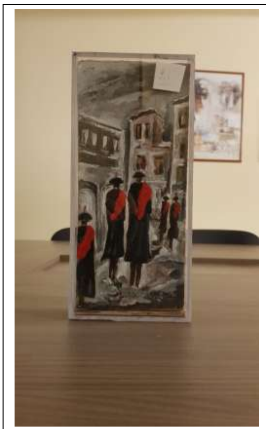
23 2021 Carabinieri in libera uscita, tecnica mista su cartone in teca in plexiglass , 14 x 29,5 x 5.