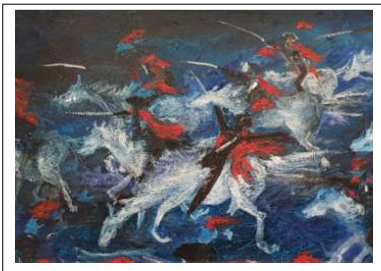
17 2019, La Carica di notte, tecnica olio su tela, 50 X 70.