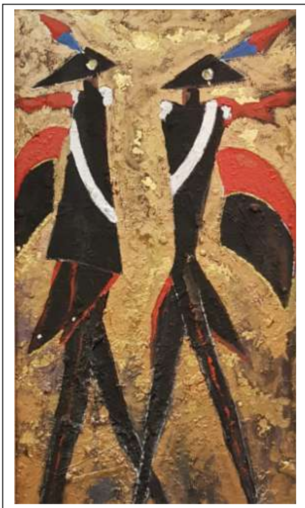
11 2020, Carabinieri stilizzati so fondo oro, tecnica mista su tavoletta legno, 41 X 71.