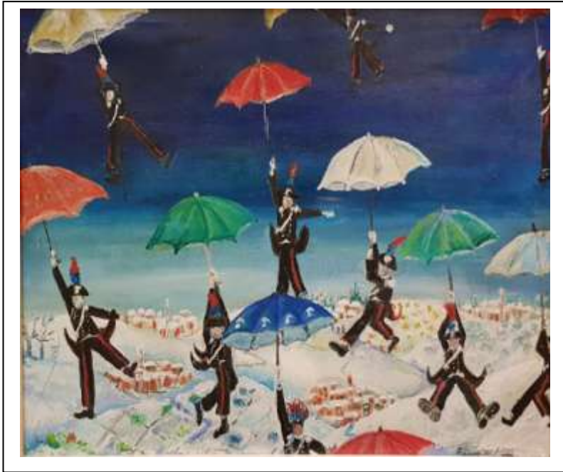
9 2020, Carabinieri Paracadutisti sulla neve, olio su tela, 60 X 80.