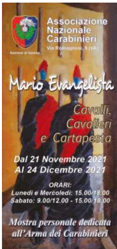
Locandina della mostra