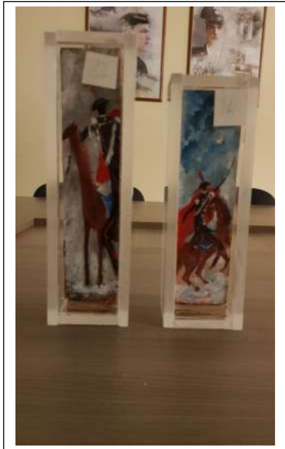
26 2021 Carabinieri a cavallo, tecnica mista in teca in plexiglass, nella parte posteriore Carabinieri in pattuglia, 14 x 29,5 x 5 e 6,5 x 20 x 5.