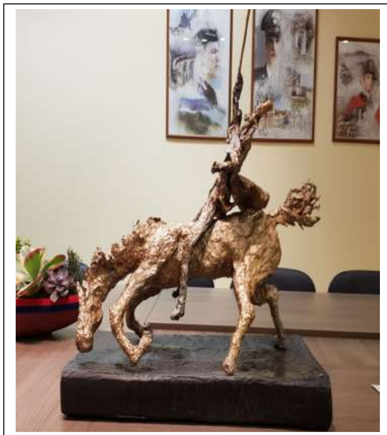
31 Carabiniere disarcionato dal cavallo, tecnica mista su scultura in cartapesta, misure 54 x 54.