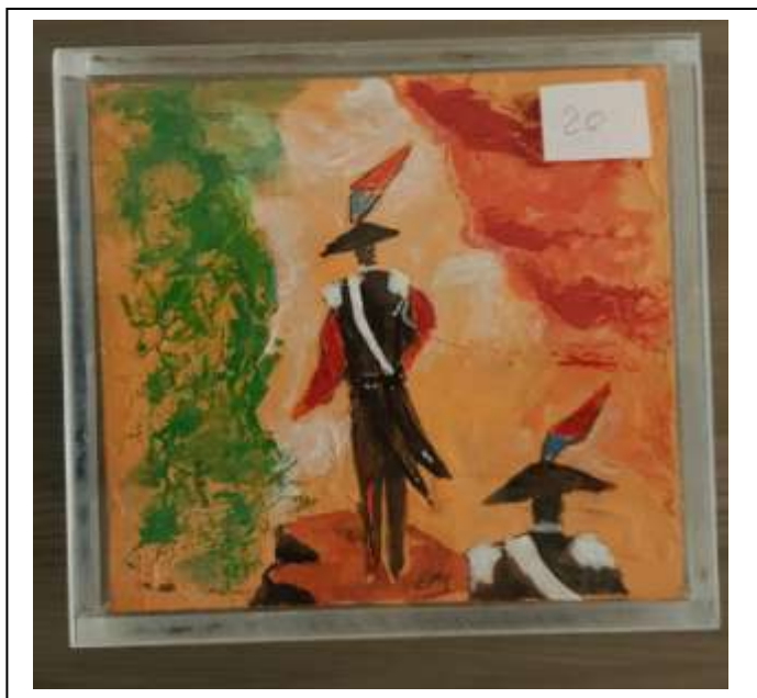
21 2021 Carabinieri e la bandiera , nella parte posteriore, carabiniere a cavallo su fondo oro, tecnica mista su cartone in teca in plexiglass, 20 x 20 x 7