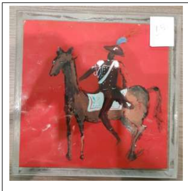
19 2021 Carabiniere a cavallo su fondo rosso posteriore, carabiniere a cavallo su fondo oro, tecnica mista su cartone in teca in plexiglass, 20 x 20 x 7.