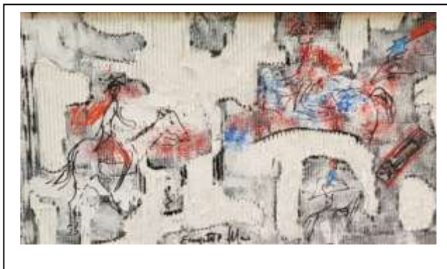
13 2021, Cavalli ( senza titolo), tecnica mista su cartone 72 X 41.